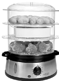
STEAM COOKER AD 634