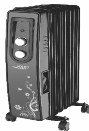
OIL HEATER AD 7801