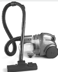
CYCLONE VACUUM CLEANER AD 7006