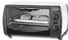
ELECTRIC OVEN AD 6003