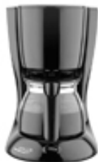
COFFEE MAKER AD 4452