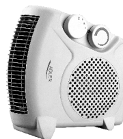
FAN HEATER AD 77