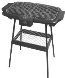
ELECTRIC GRILL AD 6602