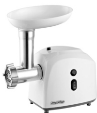
meat grinder MS 4805