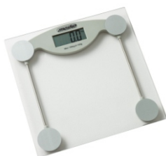
Bathroom Scale MS 8137