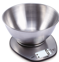
Kitchen Scale MS 3152