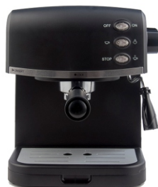
Espresso Maker MS 4409