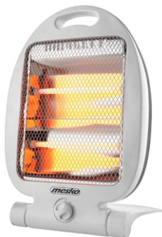
Quartz Heater MS 7710