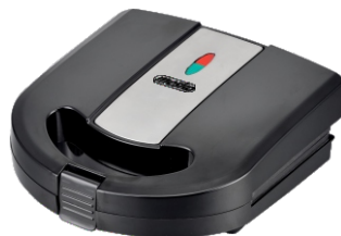
Sandwich Maker MS 3045