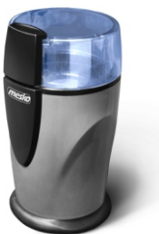
Coffee Grinder MS 4465