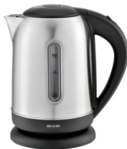
Electric Kettle MS 1288