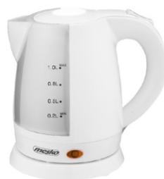
electric kettle MS 1276