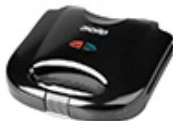
Sandwich Maker MS 3032