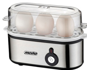
Egg Boiler MS 4485