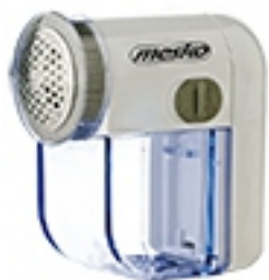
Lint remover MS 9610