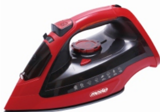
Steam Iron MS 5031