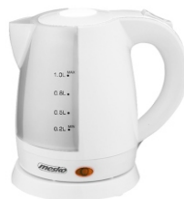
Electric Kettle MS 1276