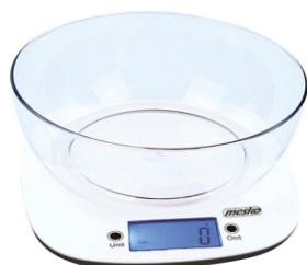
Kitchen scale with bowl MS 3165