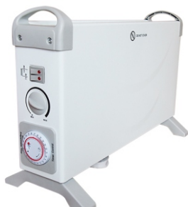
Convector heater MS 7713