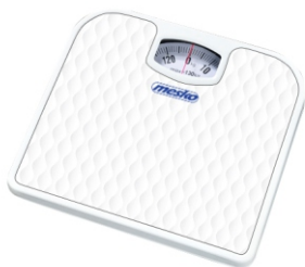
Bathroom scale MS 8160