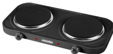
Double hot plate MS 6509