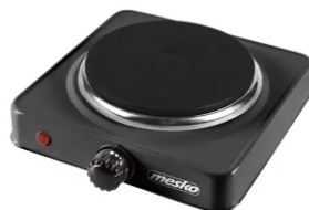
Hot Plate MS 6508