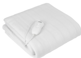
Heating Blanket MS 7419